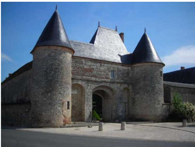
L'entrée du Château