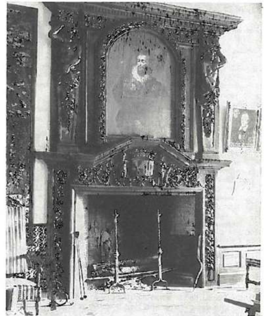
Cheminée Renaissance du château